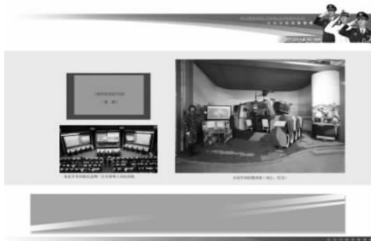
图 1-2 “赴港建军展”图文大纲小样(1)