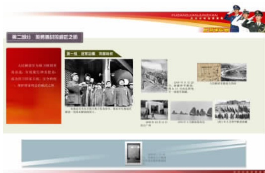
图 1-3 “赴港建军展”图文大纲小样(2)

档案专业人员在编撰图文大纲时,技术布展人员应参与其中,而不是等图文大纲完成后才让其介入。编撰过程中,双方的不断商讨有助于协调档案专业与艺术设计之间的矛盾,更好地为下一步的技术布展工作奠定基础。同时,档案展览工作人员还需对服务项目设计、合作单位洽谈等事宜进行周密的规划。确定大纲后,将档案展览规划报有关单位立项审批。