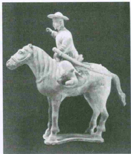
图5 骑马元人俑(现藏于陕西省博物馆)