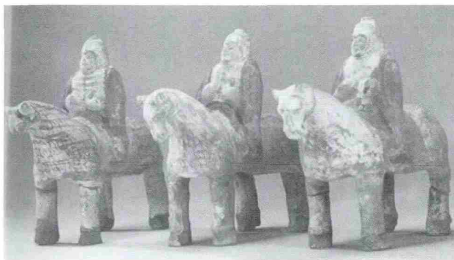
图2 骑马兵士俑(现藏于固原博物馆)

这组俑像出土于宁夏固原县南郊乡李贤墓,是北周时代的作品,高18厘米,长17厘米,厚10厘米,现由固原博物馆收藏。士兵头戴尖顶头盔,身上的盔甲雕刻有长方形格子纹样,身披黑色长袍,两手握于胸前,双脚踏马镫,显示出威武自信的神态。马的造型夸张,身体肥硕、敦实,比较秦汉时期的同类俑像而言,艺术表现大胆奇特。这组骑像俑是南北朝时代艺术文化语言的真实表露。