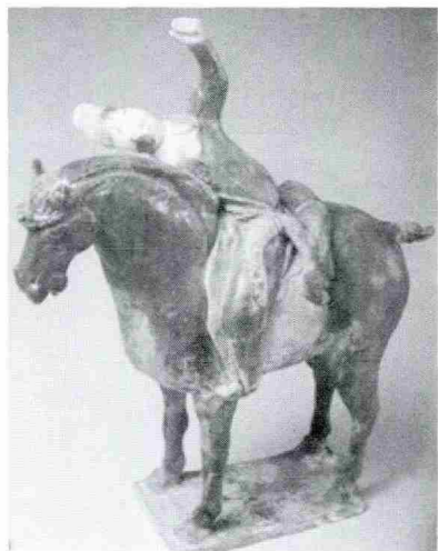
图3 狩猎骑马男子俑(现藏于陕西乾县博物馆)

作品看起来富丽堂皇。这一技法使得骑像俑的人物与马的神情生动、性格鲜明,富有真实感和亲切感。图3的狩猎骑马男子俑是唐代的作品,高38厘米,长36厘米,宽34.5厘米,1971年在陕西省乾县懿德太子墓出土的,现收藏陕西乾县博物馆。