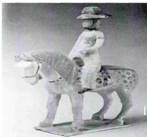
图4 白釉加彩女子陶俑像(现藏于陕西博物馆)

女子胯下骑着一匹黄色骏马,从神态上可以看出这匹马不同于以往出征的战马,神态温柔。女子左手好似轻轻拉着缰绳,像是出游踏青的感觉。这尊骑像俑反映出唐代社会妇女出行时的特征,人物所戴的风帽叫做“锥帽”,是从西域流传来的,《事物原始》中记载“锥帽创于隋代,今世士人往往用皂纱全幅缀于油帽或毡笠之前,以障风尘,为远行之服,盖本于此。” [7] 《旧唐书》中也有记载“则天之后,锥帽大行” [7][10] 这些论述印证了骑像俑文化中的写实性。