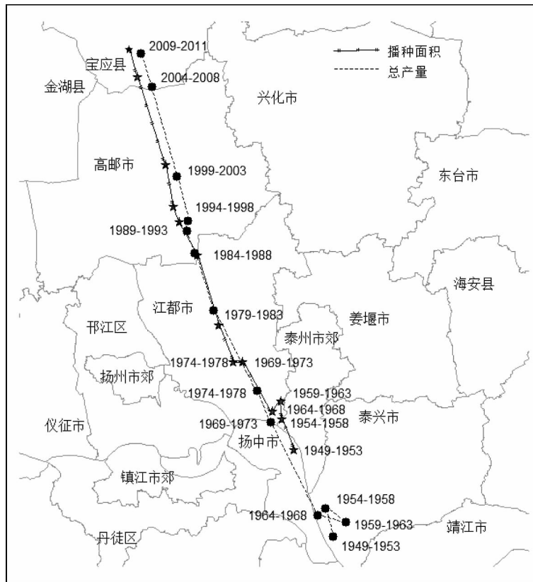
图3 江苏省水稻1949—2011播种面积和总产量迁移轨迹图

—五圩—邓家庄—秦庄—横桥—高邮市萧家庄—郑家—陈西—黎家厦—宝应县周庄—任庄。水稻总产量空间重心的迁移轨迹为:泰州泰兴市飘划镇—新港南路—褚庄村—扬中市环岛公路—源字圩—江都市范河—戴家庄—高邮市陆家庄—孟家厦—大孙家厦—奎楼拐子—葛庄—宝应县韦北村。