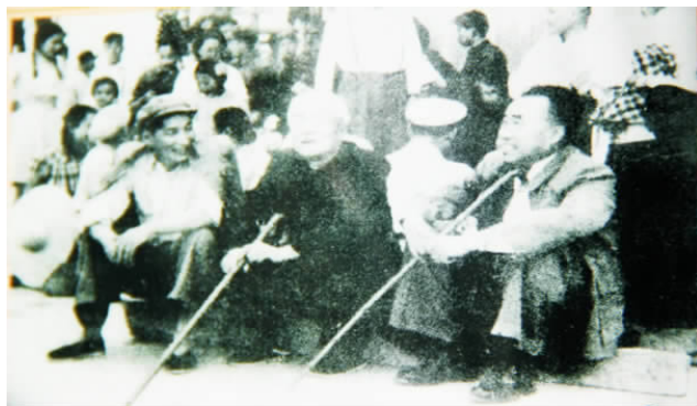
周恩来和邓颖超视察官厅水库时的照片

除了下游的洪水灾害,为人民造福”。总理又走到电站,看到电厂还没有完工,可是办公楼已经修好了,便对陪同前来的一位有关部门的负责干部提出严肃的批评。总理的批评使同志们受到了深刻的教育。当总理走到正在施工的尾水渠前,看到热火朝天的劳动场面,亲切地对大家说:“同志们好,你们辛苦了!”并勉励大家发扬艰苦奋斗,自力更生的革命精神,把电站建设好。